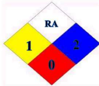
Diagrama de Hommel:

Evite inalar as poeiras. A roupa de trabalho contaminada não pode sair do local de trabalho. Use luvas de proteção/roupa de proteção/proteção ocular/proteção facial. EM CASO DE CONTATO COM A PELE: Lave com água e sabão em abundância. Em caso de irritação ou erupção cutânea: Consulte um médico. Não possui tratamento específico. EM CASO DE CONTATO COM OS OLHOS: Enxague cuidadosamente com água durante vários minutos. No caso de uso de lentes de contato, remova-as, se for fácil. Continue enxaguando. Caso a irritação ocular persista: consulte um médico. Lave as mãos e os olhos cuidadosamente após manuseio. Enxague imediatamente com água em abundância a roupa e a pele contaminadas antes de se despir. Lave a roupa contaminada antes de usá-la novamente. Não coma, beba ou fume durante a utilização deste produto. Em caso de mal estar, consulte um médico. Descarte o conteúdo/recipiente como resíduo perigoso de acordo com a legislação local.